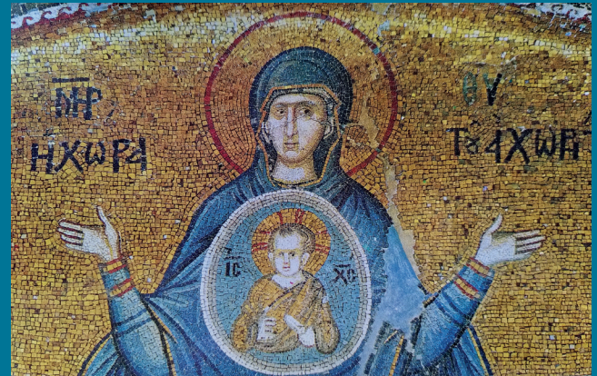
Mosaik im Chora Museum, Istanbul